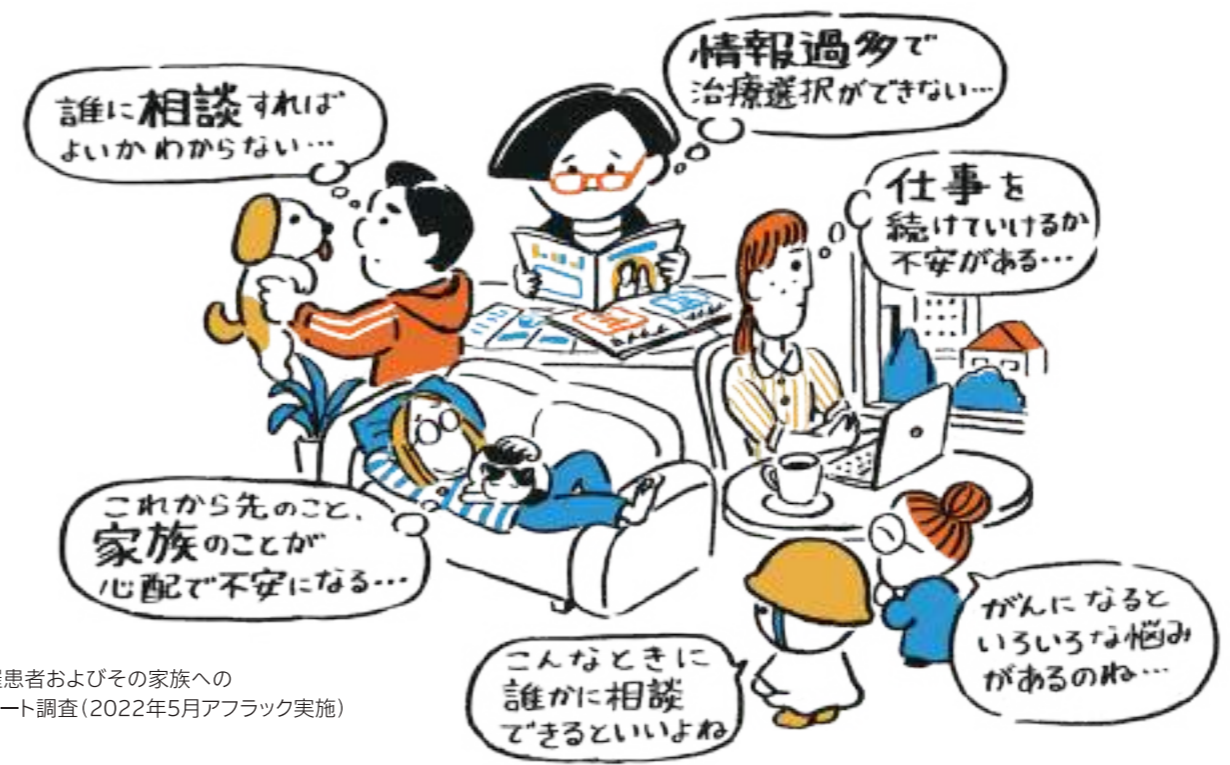
がん罹患患者およびその家族へのアンケート調査(2022年5月アフラック実施)